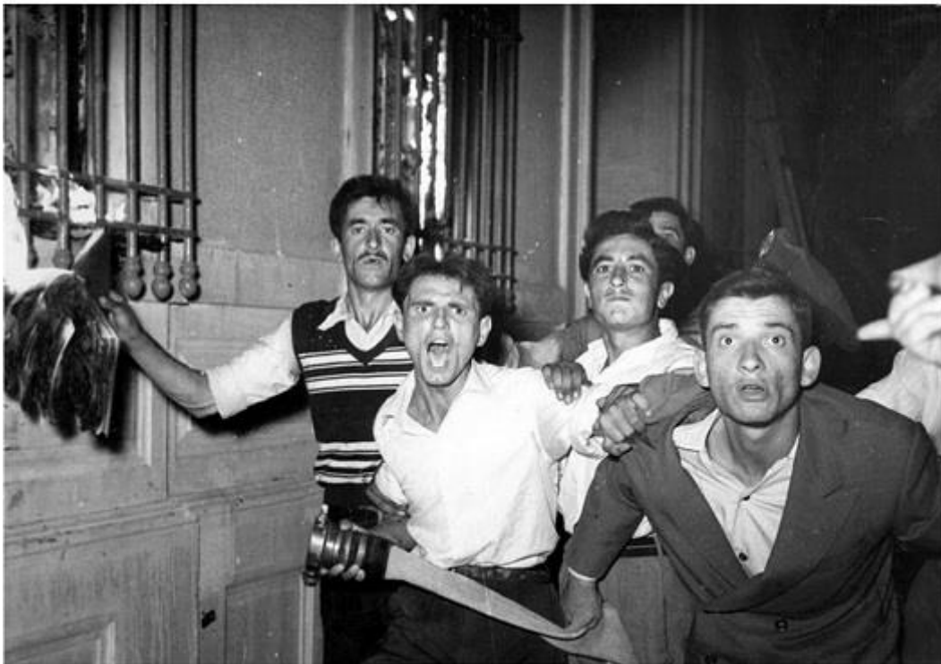
Εικόνα 2 - Εμπρησμός του ελληνικού προξενείου της Σμύρνης