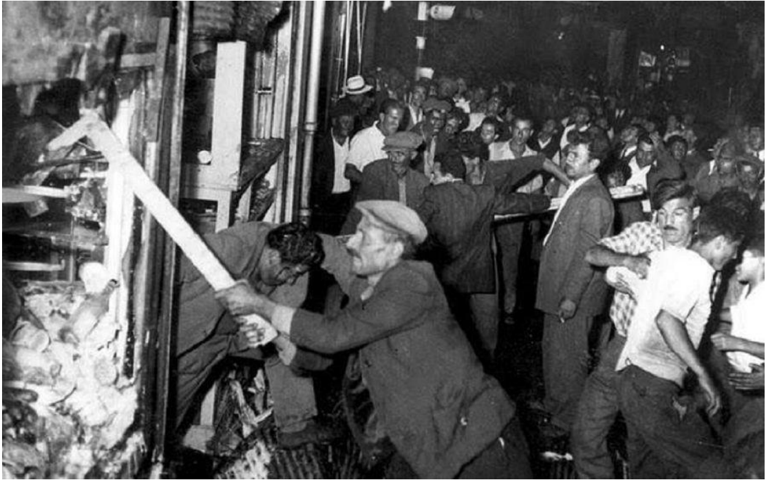
Εικόνα 3 - Εικόνες καταστροφής