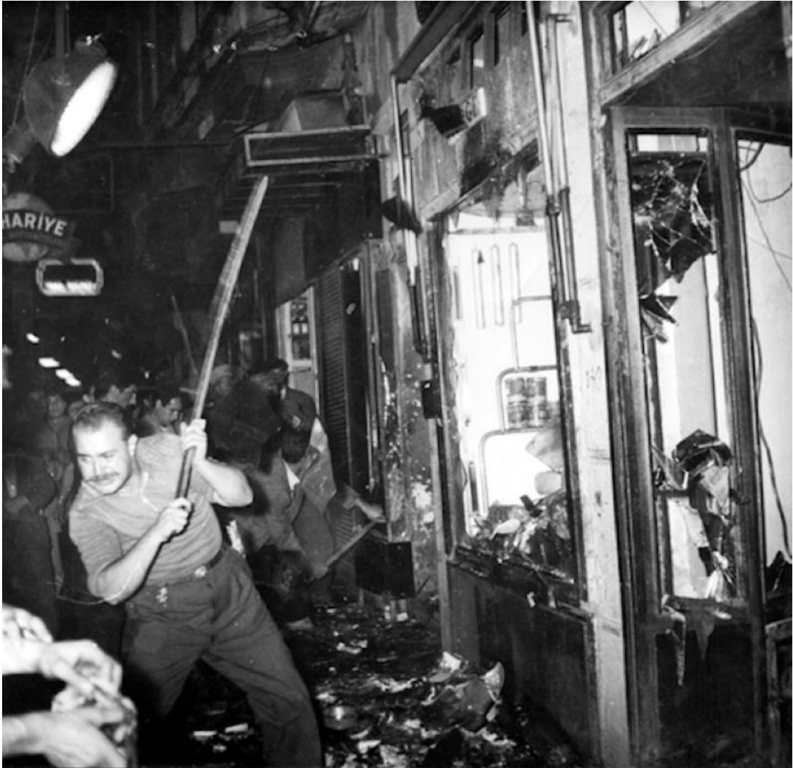
Εικόνα 7 - Ληλασίες και βανδαλισμοί