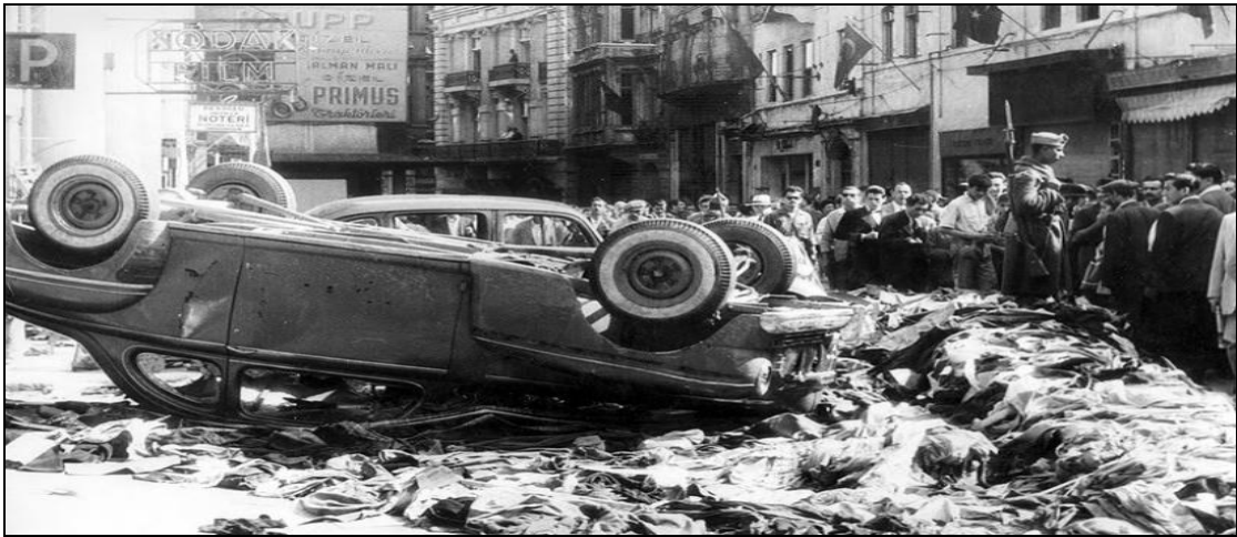
Εικόνα 1 - Η «τρίτη» άλωση της Κωνσταντινούπολης – Τα Σεπτεμβριανά του 1955