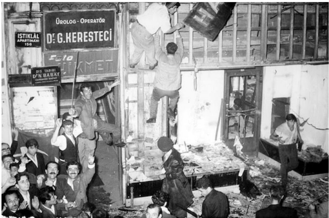
Εικόνα 6 - Ληλασίες και βανδαλισμοί