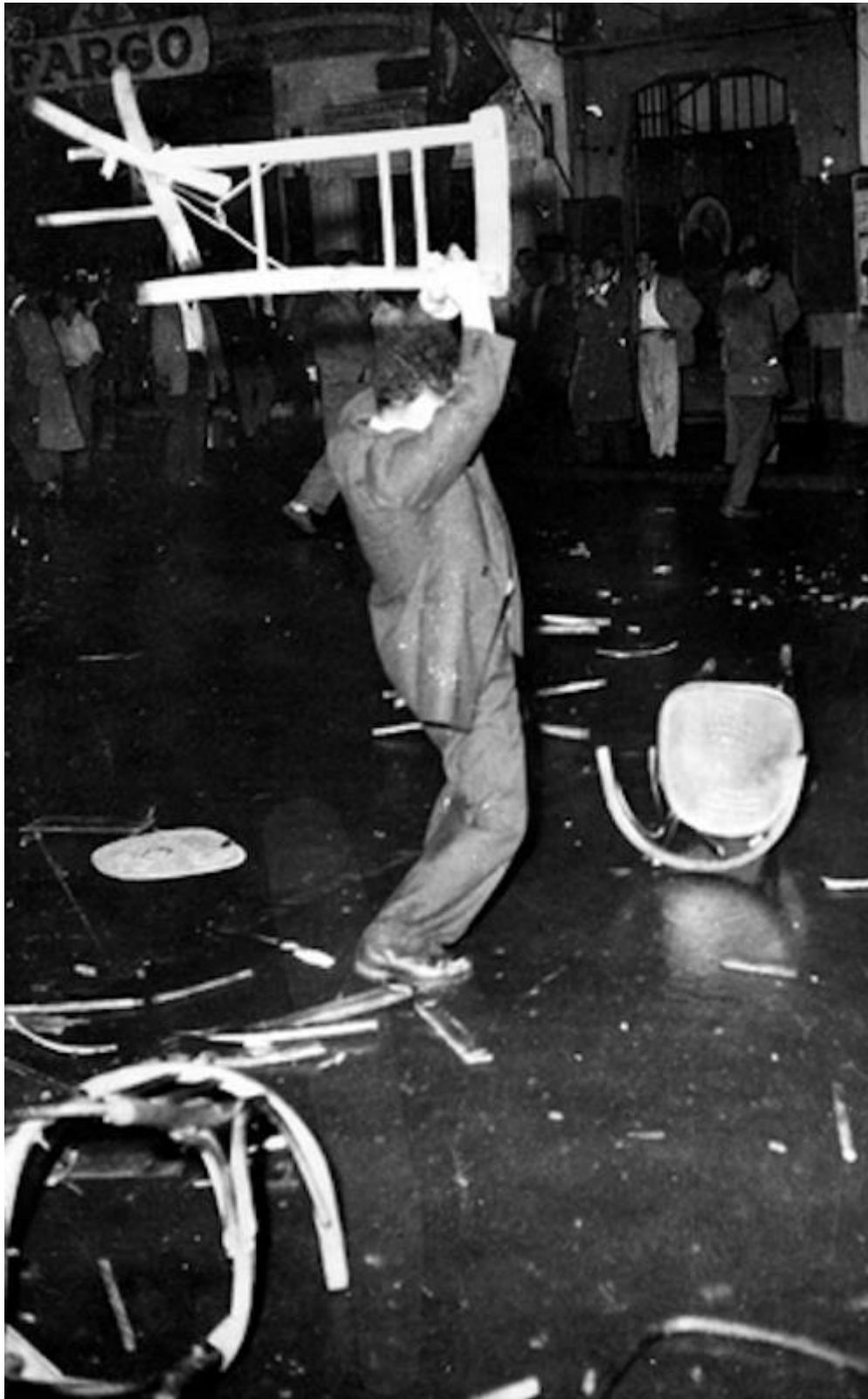
Εικόνα 5 - Καταστροφική μανία