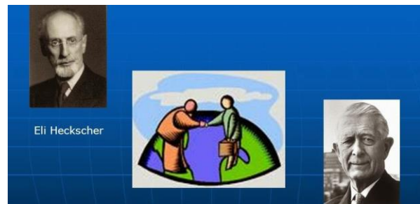
Figure 5 Eli Heckscher και Bertil Ohlin

Ο Ricardo πιο πάνω στήριζε πως κύριος παράγοντας για μια χώρα να έχει συγκριτικό πλεονέκτημα είναι καθαρά το κόστος παράγωγής του. Σε αυτή την θεωρία ο Eli και ο Bertil ήρθαν και υποστήριξαν πως υπάρχουν και άλλοι παράγοντες – συντελεστές οι οποίοι παίζουν ρόλο σε αυτό όπως η Γη και το