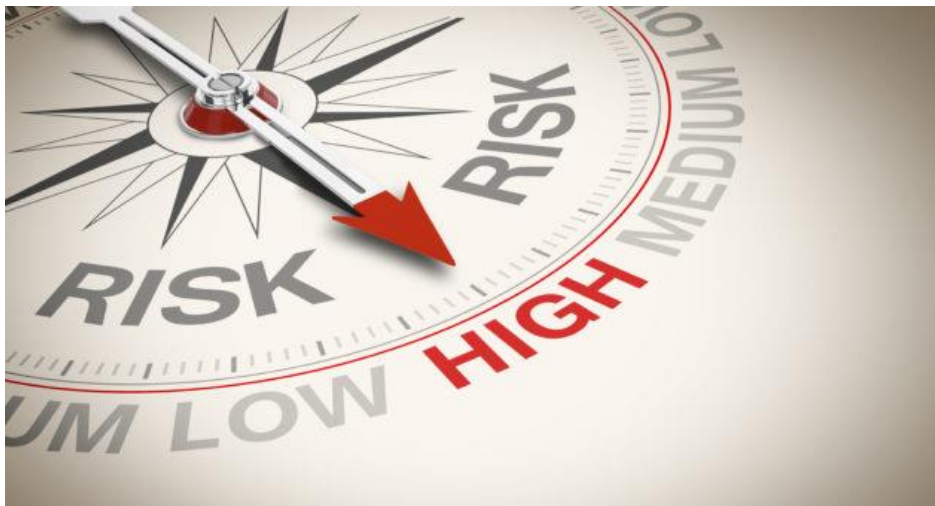
Figure 11 high Risk of globalization

Σε αυτό τον κίνδυνο αναφερόμαστε καθαρά σε επενδύσεις που έχουν μεγάλο ποσοστό αποτυχίας και ο μοναδικός λόγος και κριτήριο επένδυσης – διεθνοποίησης ενός οργανισμού είναι καθαρά οι γεωγραφικοί παράγοντες, όπως για παράδειγμα η τοποθεσία της χώρας σε σχέση με τα διάφορα μέρη της διεθνούς αγοράς. Χώρες για παράδειγμα υψηλού κίνδυνου είναι μη θετικές σε οργανισμούς που θέλουν να ακολουθήσουν την στρατηγική διεθνοποίησης. Λόγο των ασταθών πολιτικών σχέσεων υπάρχει σοβαρή και σίγουρα αποτυχία στην στρατηγική διεθνοποίησης σε χώρες υψηλού κίνδυνου.