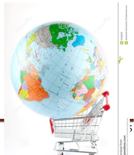
Figure 20 Παγκόσμια "ΑΓΟΡΑ"

Για κάθε κλάδο και εργασία η διαδικασία διεθνοποίησης διαφοροποιείται και έχει ένα εύρημα από επιλογών. Αντίθετα ο βαθμός επέκτασης και διεξόδου της επιχείρησης στις ξένες αγορές εξαρτάται καθαρά από τις πληροφορίες που έχει διαθέσιμες η συλλέγοντας τις γιατί ξένες αγορές. Σίγουρα πολλές φορές και η εμπειρία του