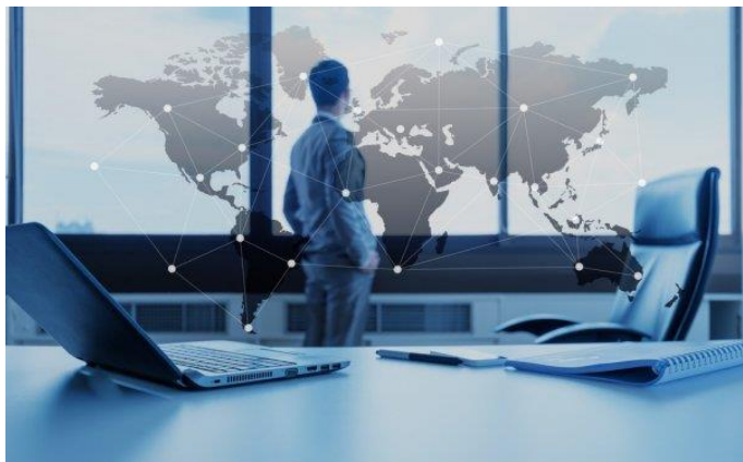
Figure 1 Παγκοσμιοποίηση

Έχοντας μελετηθεί οι ορισμοί και οι διάφορες έννοιες της Παγκοσμιοποίησης πιο Κάτων έγινε μια ευρύτερη ανάλυση του Ορισμού Παγκοσμιοποίησης. Επιπρόσθετα γίνεται αναφορά στο δεύτερο μεγάλο ορισμό που συνάδει με την έννοια της Παγκοσμιοποίησης την Διεθνοποίηση.