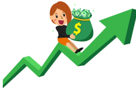
Figure 10 Πλεονεκτήματα Διεθνοποίησης

Σημαντικό είναι να ανεγερθεί πως συμπεριλαμβανομένων το πιο πάνω σημαντικό ρόλο πηζει στη ανάληψη της πολυεθνικής δραστηριότητας οι εκμετάλλευση οικονομιών κλίμακας και οι αλλαγές στις συνθήκες ζήτησης, αναδιοργάνωσης θέσης στην εγχώρια αγορά και η αυξανόμενη εκμετάλλευση χαμηλότερου κόστους στις χώρες υποδοχής.