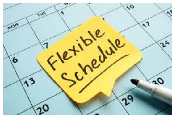
Figure 15 flexible working methods

Η αγορά εργασίας ήταν καθαρά μια ανάγκη κάθε ατόμου , προοριζόταν με βάση τις γνώσεις του και τις δεξιότητες του σαν άτομο. Μέσω κόποι interview μιας παρουσίασης των προσωπικών ενδιαφερόντων και ικανοτήτων κρινόταν ένα ήταν κόπια έμπειρος η και κατάλαλος για την θέση που προοριζόταν. Σίγουρα σήμερα στον 21 ο αιώνα που βαδίζουμε οι μορφές εργασίας έχουν