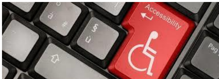
Figure 14 AMEA ΚΑΙ ΤΕΧΝΟΛΟΓΙΑ

Βεβαίως με την βοήθεια της παγκοσμιοποίησης των εθνών και ευρύτερα της παγκοσμιοποίησης στην αγορά εργασίας βλέπουμε πως το γυναικείο φύλο αρχίζει να αναπτύσσεται στο διαδίκτυο και με μεγάλα ποσοστά όπου μέσα από