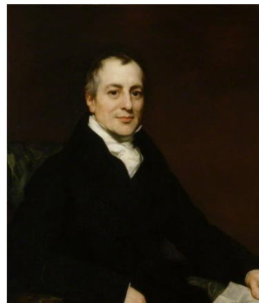
Figure 4David Ricardo

Μια ακόμη θεωρεία η οποία Διατυπώθηκε για πρώτη από το DavidRicardoΆγγλος οικονομολόγος και πολιτικός ένας θερμός υποστηρικτής της κλασικής οικονομίας του 18 ου αιώνα, στο βιβλίο του « TheprinciplesofPoliticalEconomyandTaxation», Σε αυτήν την θεωρεία η οποία δεν διαφέρει κατά πολύ από την