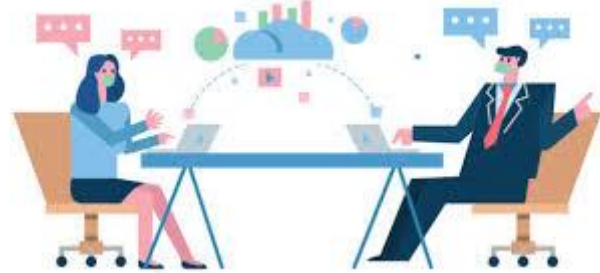
Figure 18 Covid-19

Ένα ακόμη μεγάλο «πλήγμα» που δεκτικέόλος ο πλανήτης ήταν η καταστροφική νόσος επονομαζόμενη COVID-19 που φαίνεται πως πλήξη για καλά ολόκληρο τον πλανήτη. Πολλά είναι τα παραδείγματα από το λόγο του αναγκαστικού εγκλίσου και του ολικού lockdown, πλήξη καναρκεά οι οικονομίες όλων των κρατών λόγω του ότι αναγκάστηκαν μικρές αλλά και μεγάλες επιτηρήσεις να κλίσουν και να μείνουν πόλοι έως και άνεργοι. Έτσι ο