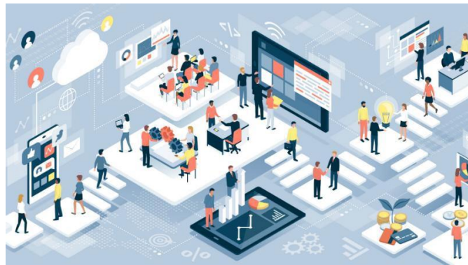
Figure 12 Workplace figure

Κάθε άνθρωπος έχει το δικαίωμα στην εργασία. Άτομος με τον οποίο θα αποκτήσει τα αγαθά για την ομαλή συμβίωση του είναι εντάσσοντας τον στο μηχανισμό που ονομάζεται αγορά εργασίας. Με πιο απλά λόγια για να καλύψει τις ανάγκες του πρέπει να εργαστεί άσχετα με το πόσο πληρωμή και να καλύψει τις ανάγκες του. Από πολύ παλιά οι εργαζόμενοι έχουν πρωταγωνιστικό ρόλο στην οικονομία αφού εάν δεν υπήρχαν δεν θα υπήρχε τίποτα και θα ήταν όλα σταματήσει στην παλαιολιθική εποχή χωρίς ανάγκες για πρόοδο του πολιτισμού και του κόσμου γενικότερα. Με σημαντική δύναμη, ο εργαζόμενος είναι υπεύθυνος εάν θα εργαστεί πέντε ώρες θα εργαστεί σε τι κλίμα θα εργάζεται εάν θα παραιτηθεί, εάν θα αποκτήσει γνώσεις και δεξιότητες σε αυτό που του ορίζεται να κάνει η και εάν θα ενταχθεί σε μια εργατική ένωση.