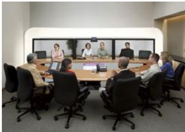
Figure 16 Example of thleworking

Ορισμός τηλεργασία είναι ο σοναφορά κατά οποιαδήποτε μορφή εργασίας η οποία εκτελείτε χωρίς υποχρεωτική επαφή του εργαζόμενου στο χώρο εργασίας του. Αφορά την οποιαδήποτε εργασία η