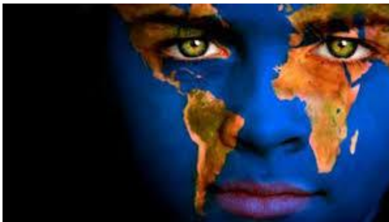
Figure3 Παγκοσμιοπήςη με κέντο τον Ανθρωπο

Παρόλο που σε ένα μεγάλο ποσοστό αυτές οι όψεις ( συνιστώσες) της