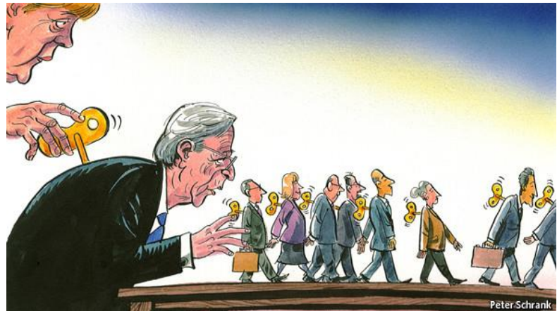
Figure 3 "NEO-Μερκαντισμός

Η θεωρία αυτή αναπτύχθηκε καώ τον 16 ο και 17 ο αιώνα. Αρχή του Μερκαντισμού όριζε ότι « όταν και άλλες χώρες εξαγουν τότε πουλάμε όσο το δυνατό πιο φθηνή για να μην χάσουμε από τις εξαγωγές και μας μένει το εμπόρευμα »