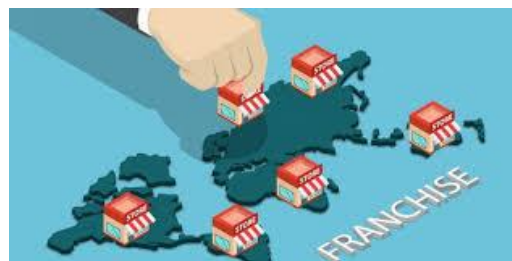
Figure 8 Franchising Logo

περιουσιακών στοιχείων. Ο δικαιούχος – franchisee , σε αυτή την περίπτωση είναι υπόχρεος να πραγματοποιεί τις ίδιες δραστηριότητες- υπηρεσίες με των δικαιοπάροχο – Franchiser .