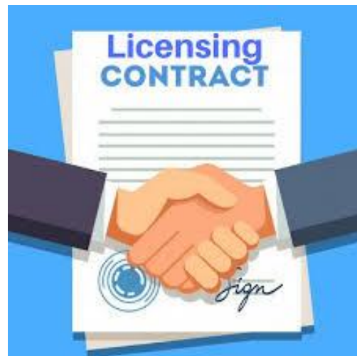
Figure 9 Licensing Contract

Είναι πολλές φορές τρόπος για τους μεγάλους οργανισμούς να διακινούν τα χρήματά τους με σκοπό την απόκρυψη της πλήρους εικόνας των οικονομικών τους στοιχείων για τις πλύστες φορές απάτης και φοροαπαλλαγής.