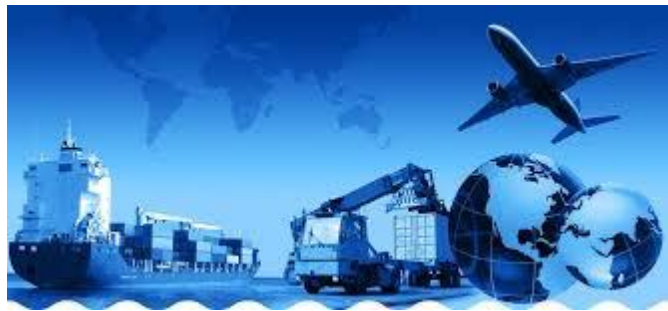
Figure 7 Trading Shipping Figure

Είναι σημαντικό να αναφερθεί πως μερικές φορές η τρόπος διεθνοποίησης που κάθε οργανισμός θα αποφασίσει να ακολουθήσει συνεπάγεται άμεσα με το προϊόν που πρόκειται είτε να εξάγει είτε να εισάγει και με την χώρα στην οποία γίνεται η ανταλλαγή αυτή. Ένα απλό παράδειγμα είναι οι δασμοί κάθε χώρας και εάν είναι δυνατόν η εισαγωγή η εξαγωγή προϊόν με την χώρα που πρόκειται μια επιχείρηση να εξάγει η να εισάγει.