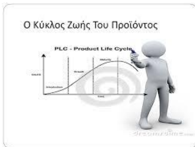
Figure 6 Κύκλος Ζωής Προϊόντος

Σε αυτή την φάση το προϊόν αποκτά γρήγορους ρυθμούς παραγωγής, όλα τυποποιούνται η επιχείρηση γίνεται ακόμα πιο ισχυρή, η τιμή σιγά σιγά σταθεροποιείται λόγω αυξημένων εσόδων έτσι η χώρα αποκτά ακόμη πιο σημαντικό πλεονέκτημα στο διεθνές εμπόριο.