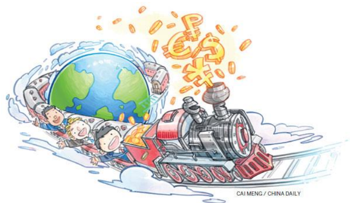
Figure 13 Globalization of the nations and work

Το φαινόμενο που ονομάζεται παγκοσμιοποίηση πειράζει άμεσα την εργασία και την αγορά εργασίας. Δημιουργεί άμεσα την αύξηση του βαθμού κινητικότητας και ευελιξίας στην αγορά εργασίας, με σημαντική επίδραση στο ύψος του μισθού. Μέσω της ραγδαίας ανάπτυξης των συγκοινωνιών και των επικοινωνιών μειώνονται οι αποστάσεις και ανατάσσεται μια ιδέα πως όλοι η κατοικώ του πλανήτη ανήκουν και έχουν όλοι το δικαίωμα να ανήκουν σε ένα παγκόσμιο χωρίο. Η συνεχής κινητικότητα των εργαζομένων και ευρύτερα των επιτηρήσεων έχει ως αποτέλεσμα στην αλλαγή της γεωγραφικής ζώνης της παράγωγης και της αγοράς εργασίας. Με τη βοήθεια της παγκοσμιοποίησης γίνεται πιο εύκολη η διάδοση της τεχνολογίας και τις μεταφορές των γονέων και των ιδεών και αυτό είναι υπέρ της ανάπτυξης σε οποιοδήποτε χώρο η κλάδο εργασίας. Σε συμπέρασμα πως η ανάπτυξη των πολυεθνικών επιτηρήσεων και των