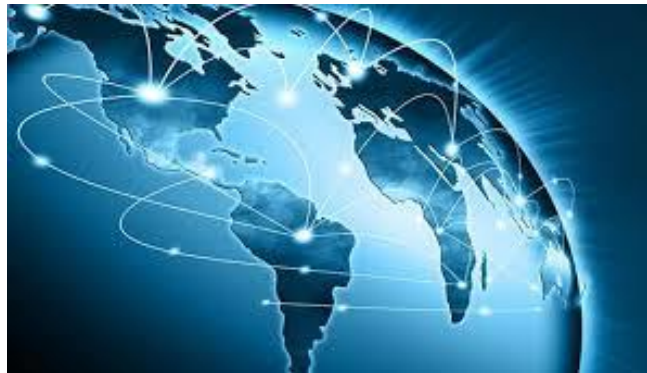
Figure 2 Διευθνοποίηση Χωρων.

Τι είναι λοιπόν η παγκοσμιοποίηση?. Η λέξη αυτή χωρίζεται σε δύο λέξεις με το πρώτο συνθετικό της λέξης παγκόσμιο και δεύτερο της λέξης ποίηση από το ρήμα ποιώ. Αυτό δηλώνει κάτι που θα γίνει παγκοσμίααγκαλιάζοντας όλο τον κόσμο ολόκληρο τον πλανήτη. Είναι λοιπόν αυτή αλλαγήαποδεκτοίαπόολόκληρο τον πλανήτη? Ερωτήματα τα οποία γιανά απαντηθούν πρέπει να υπάρχουν έργα και πράξεις από όλους τους κυβερνήτες των χωρών.