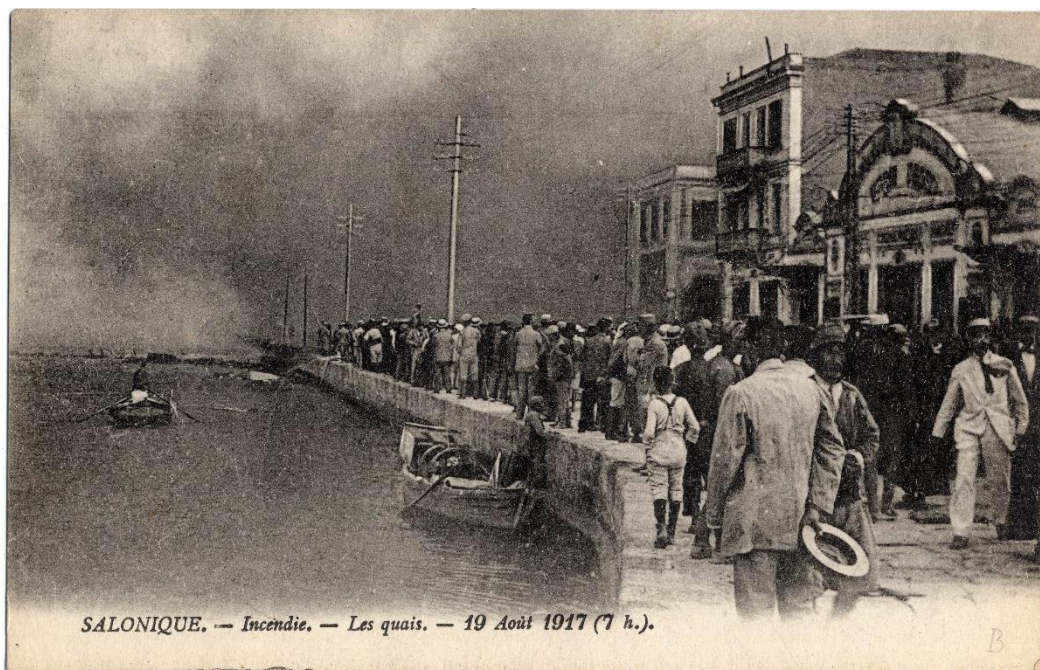
Καρτ-ποστάλ 8: Άποψη της πυρκαγιάς από την παραλιακή οδό, Ι.Α.Μ. ΑΕΕ ΡΗΘ 02.5