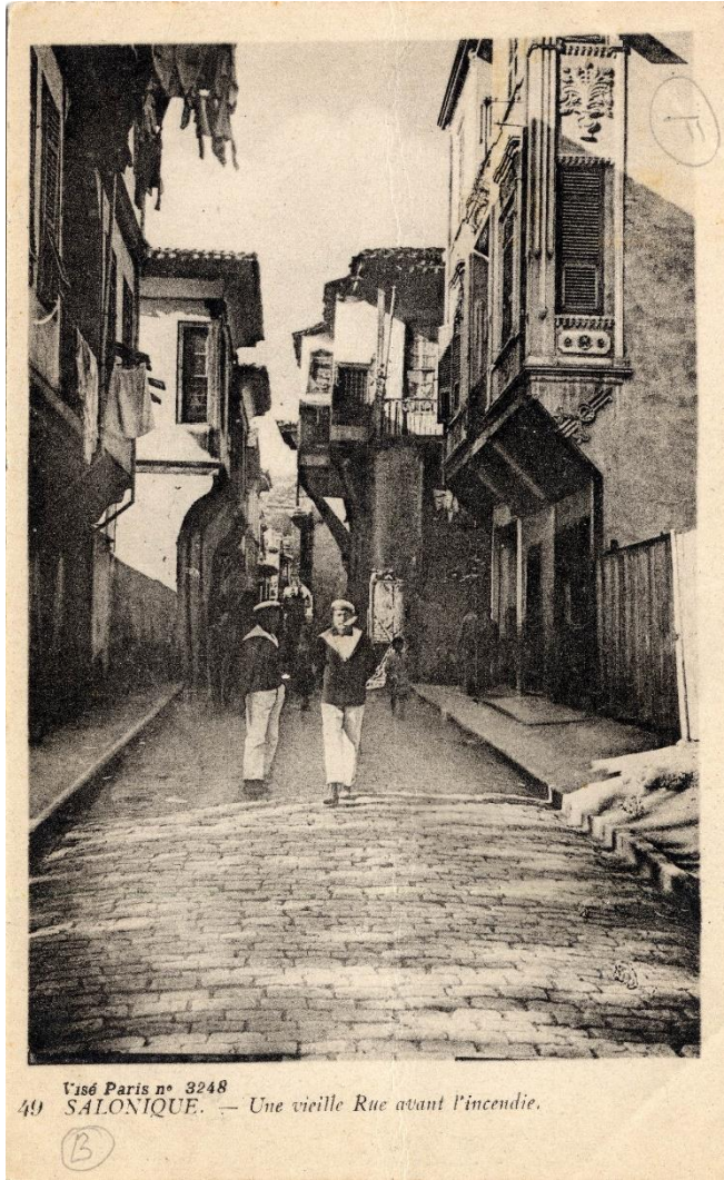
Καρτ-ποστάλ 5: Στενά δρομάκια, ρυμοτομία πόλης Ι.Α.Μ., ΑΕΕ ΡΗΟ 02.04