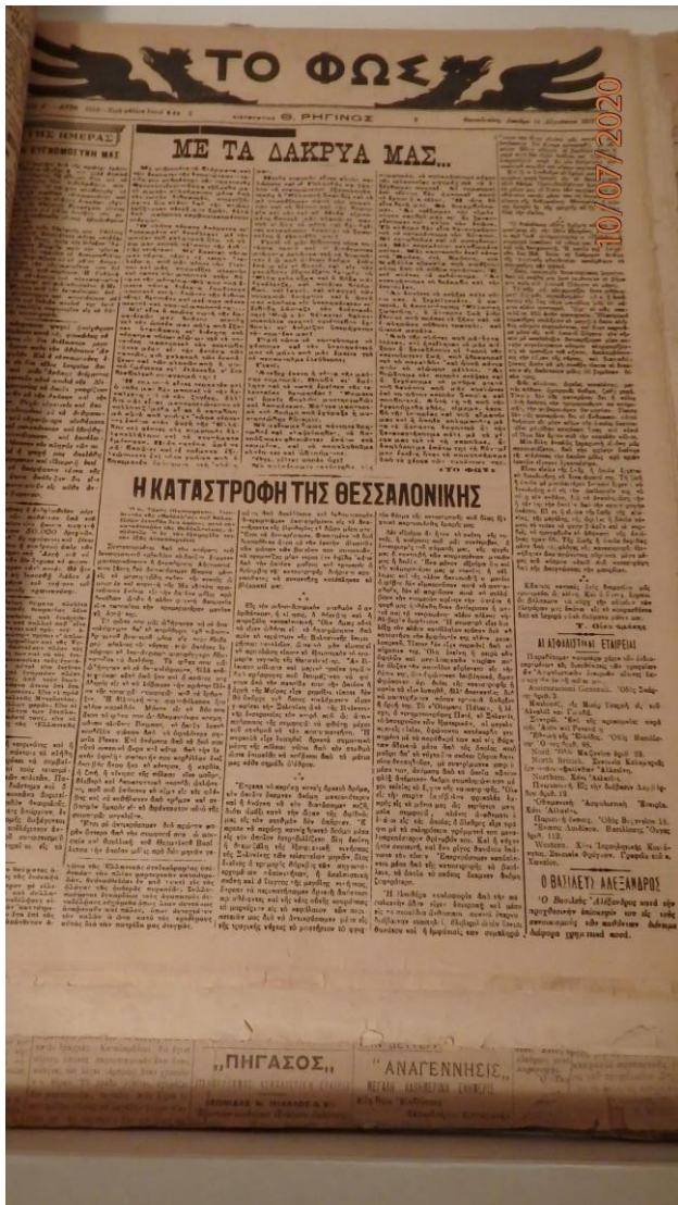
Έγγραφο 1: Η εφημερίδα Φως την πρώτη μέρα της επανακυκλοφορίας της μετά την πυρκαγιά της 5 ης Αυγούστου 1917, Ε.Σ.Η.Ε.Μ.Θ.