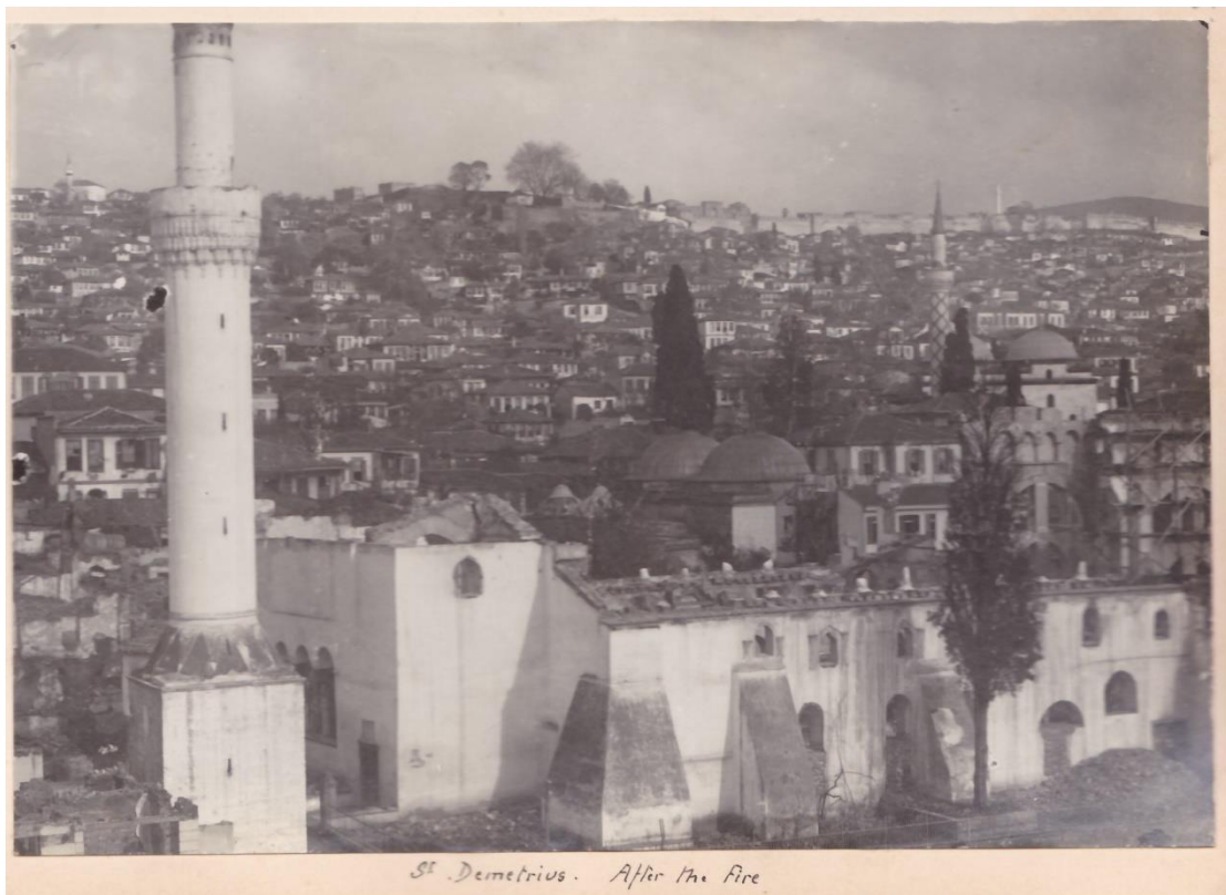
Φωτογραφία 10: Ο ναός του Αγίου Δημητρίου μετά την πυρκαγιά(χωρίς στέγη), Κ.Ι.Θ., φάκ.92, υπ.3β