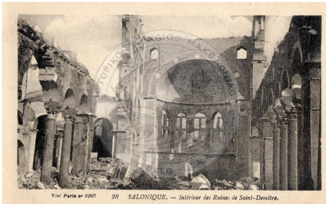
Καρτ-ποστάλ 11: Εσωτερική άποψη του ναού του Αγ.Δημητρίου, Ι.Α.Μ., Συλλογή Οικονόμου