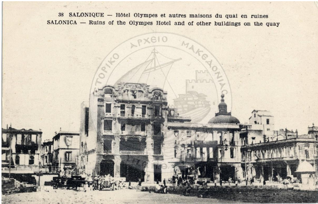
Καρτ-ποστάλ 9: Η παραλία της Θεσσαλονίκης μετά την πυρκαγιά