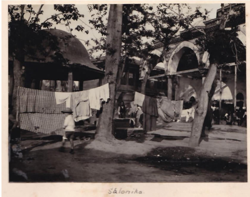
Φωτογραφία 13: Άστεγοι βρίσκουν καταφύγιο σε λατρευτικούς χώρους, Κ.Ι.Θ., φάκ.92, υπ.3β