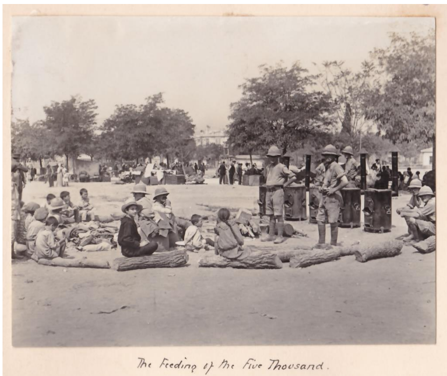
Φωτογραφία 14: Περίθαλψη των άστεγων πυροπαθών, Κ.Ι.Θ., φάκ.92, υπ.3β