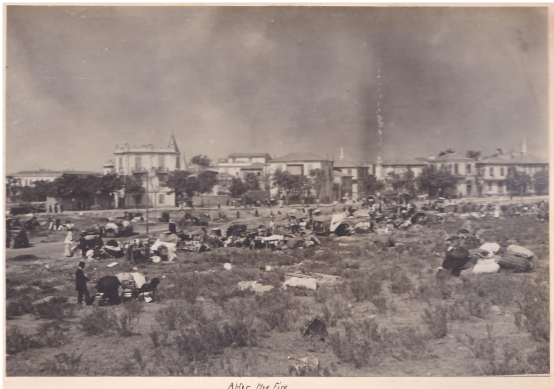
Φωτογραφία 12: Μετά τη φωτιά. Μετακίνηση των πυροπαθών στα περίχωρα της πόλης, Κ.Ι.Θ., άκ.92, υπ.3β