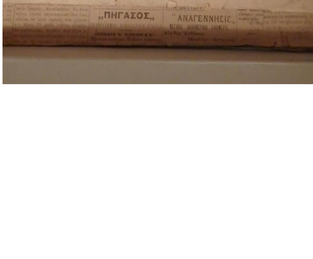
Έγγραφο 2: Εφημερίδα Πρόδος, Η πρώτη αναφορά στην πυρκαγιά της Θεσσαλονίκης Αθήνα 7 Αυγούστου 1917