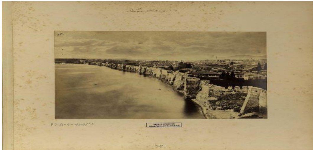
Φωτογραφία 1: Η φωτογραφία της Θεσσαλονίκης όπως είναι στο λεύκωμα των αδελφών φωτογράφων Αμπντουλάχ