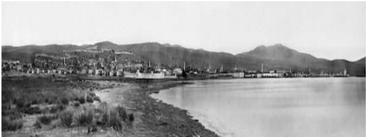
Φωτογραφία 2: Γιόσεφ Σέκελ (Αυστριακός περιηγητής), Θεσσαλονίκη, 1863 στο: https://www.voria.gr/article/i-istories-piso-apo-tis-dio-paleoteres-fotografies-tis-thessalonikis