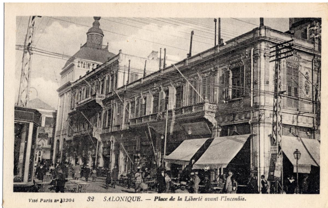
Καρτ-ποστάλ 4: Η πολύβουη πλατεία Ελευθερίας πριν την πυρκαγιά