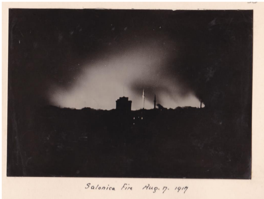
Φωτογραφία 7: Η Θεσσαλονίκη στις φλόγες