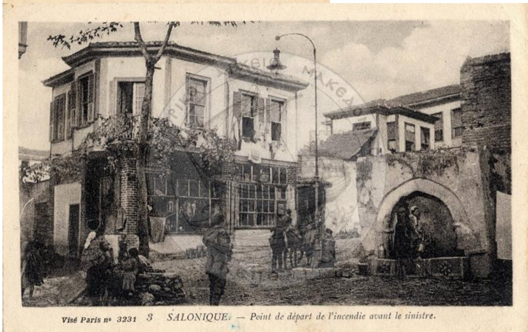
Visé Paris n° 3231 3 SALONIQUE. — Point de départ de l'incendie avant le sinistre.