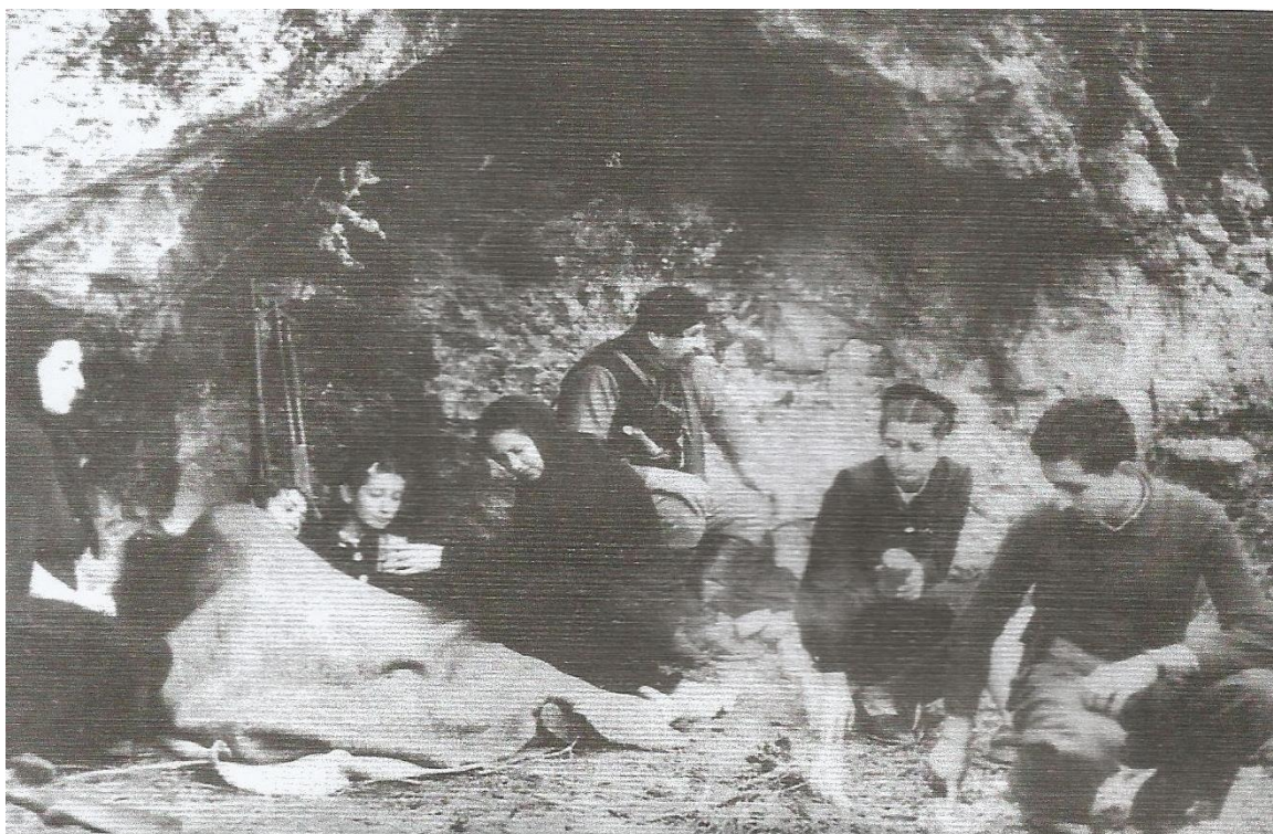
Η έξοδος στο βουνό. Ο καπετάνιος Πετρακογιώργης με όλη του την οικογένεια.