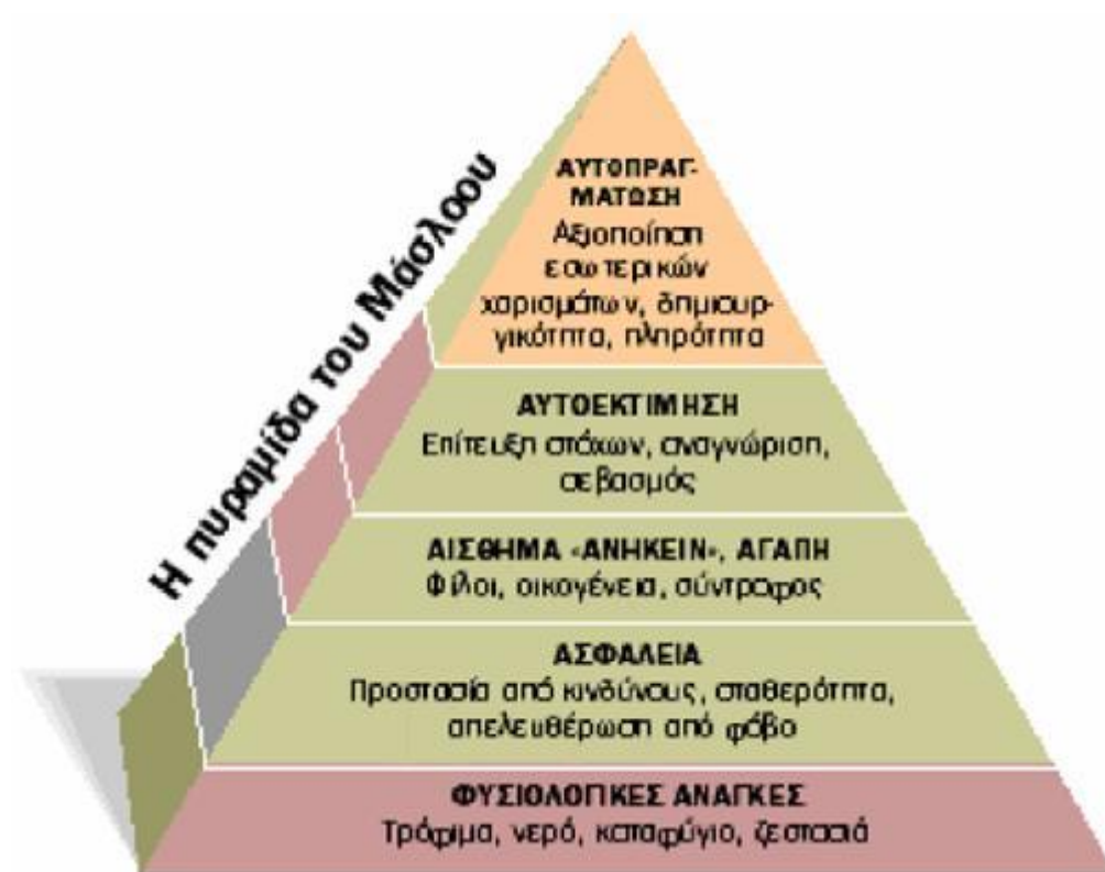
Σχήμα 1: η πυραμίδα ιεράρχησης των αναγκών κατά τον Maslow

Η ιεράρχηση των αναγκών μπορούν να διαφοροποιηθούν βάση των προσωπικών αναγκών και ιδιαιτεροτήτων του κάθε ατόμου, τις προσωπικές αξιολογήσεις του, το κοινωνικό και εργασιακό του περιβάλλον.