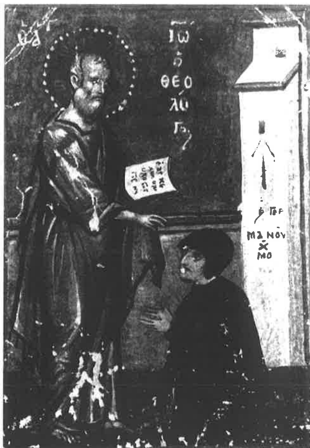
Εικ. 11. Γερμανός μοναχός: Sinait. gr. 198 , φ. 199 v (Spatharakis).