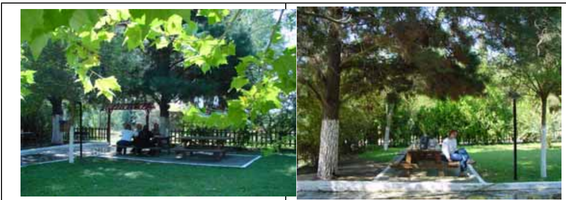
Εικόνα 5: Η χρήση του υπαίθριου χώρου σήμερα

ΕΡΓΟ 4 ο Υπαίθριος Χώρος Περιβαλλοντικής Εκπαίδευσης. Ο υπαίθριος χώρος περιβαλλοντικής εκπαίδευσης προτείνεται να αποτελεί έναν ειδικά διαμορφωμένο χώρο με καθιστικά προσαρμοσμένα στο ευρύτερο τοπίο (Εικόνα 5).