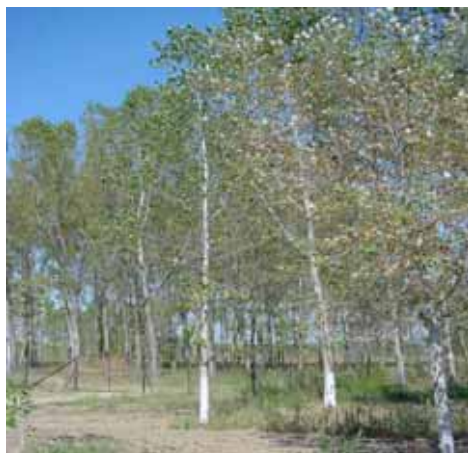
Εικ.2: Η εγκατάσταση της τεχνητής βλάστησης (λευκοκαλλιέργειες)

Τα περισσότερα πτηνά που ενδημούν στον υγροβιότοπο του Δέλτα του Νέστου προστατεύονται από Διεθνείς Συμβάσεις (RAMSAR, Βέρνης) και τις Κοινοτικές Υποχρεώσεις της χώρας προς την Ε.Ο.Κ. (Οδηγία 79/409, NATURA 2000) και πολύ λιγότερο από την Εθνική Νομοθεσία.