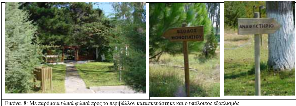
Εικόνα 8: Με παρόμοια υλικά φιλικά προς το περιβάλλον κατασκευάστηκε και ο υπόλοιπος εξοπλισμός

ΕΡΓΟ 5°: Καθαριότητα του χώρου, που πρέπει να αποτελεί από τα πρώτα και κύρια μελετήματα του Δασαρχείου. Η καθαριότητα θα αφορά και την φύλαξη των εγκαταστάσεων, όποτε στη δεύτερη περίπτωση η αποκομιδή των σκουπιδιών θα γίνει από τον ΟΤΑ.