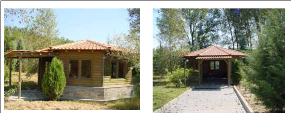
Εικόνα 4. Κατασκευή ξύλινου αναψυκτηρίου και περιβάλλουσα βλάστηση

ΕΡΓΟ 4 ο Υπαίθριος Χώρος Περιβαλλοντικής Εκπαίδευσης. Ο υπαίθριος χώρος περιβαλλοντικής εκπαίδευσης προτείνεται να αποτελεί έναν ειδικά διαμορφωμένο χώρο με καθιστικά προσαρμοσμένα στο ευρύτερο τοπίο (Εικόνα 5).