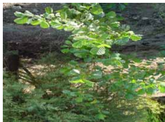
Εικόνα 6: Εμπλουτισμός της περιοχής με βλάστηση

Επίσης κατασκευάζεται δίκτυο μονοπατιών που συνδέει το χώρο στάθμευσης με τον κεντρικό πεζόδρομο πρόσβασης στο χώρο, έτσι ώστε να δίνεται δυνατότητα στον επισκέπτη να ακολουθήσει πεζοπορική πορεία για την περιήγησή του (Εικόνα 7).