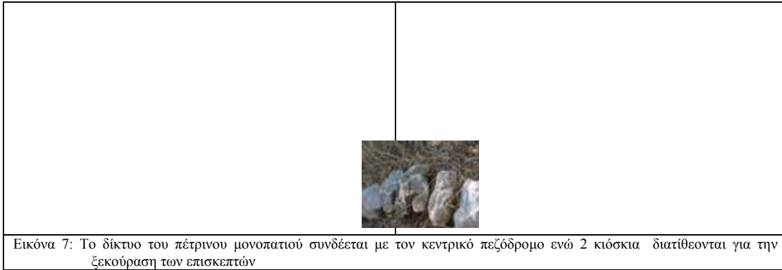
Εικόνα 7: Το δίκτυο του πέτρινου μονοπατιού συνδέεται με τον κεντρικό πεζόδρομο ενώ 2 κιόσκια διατίθενται για την ξεκούραση των επισκεπτών

ΕΡΓΟ 5°: Καθαριότητα του χώρου, που πρέπει να αποτελεί από τα πρώτα και κύρια μελετήματα του Δασαρχείου. Η καθαριότητα θα αφορά και την φύλαξη των εγκαταστάσεων, όποτε στη δεύτερη περίπτωση η αποκομιδή των σκουπιδιών θα γίνει από τον ΟΤΑ.