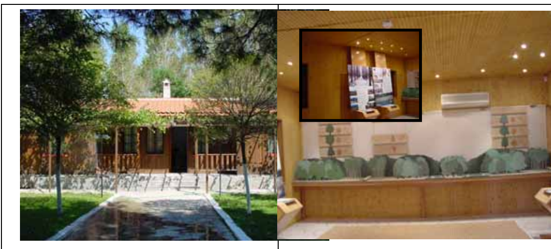
Εικόνα3.Κέντρο Περιβαλλοντικής Εκπαίδευσης όπως διαμορφώθηκε με κατάλληλο εκπαιδευτικό υλικό

ΕΡΓΟ 3 ο : Κέντρο Περιβαλλοντικής Εκπαίδευσης - Αναψυκτήριο . Το ξύλινο οίκημα του Δασαρχείου μαζί με το νέο ξύλινο οίκημα μετατρέπεται σε Κέντρο Περιβαλλοντικής Ενημέρωσης.Το περίπτερο περιβαλλοντικής ενημέρωσης στελεχώθηκε με κατάλληλο προσωπικό (περιβαλλοντολόγο και ξεναγό) ενώ το εσωτερικό διαθέτει πλούσιο εκπαιδευτικό υλικό (Εικ. 3).