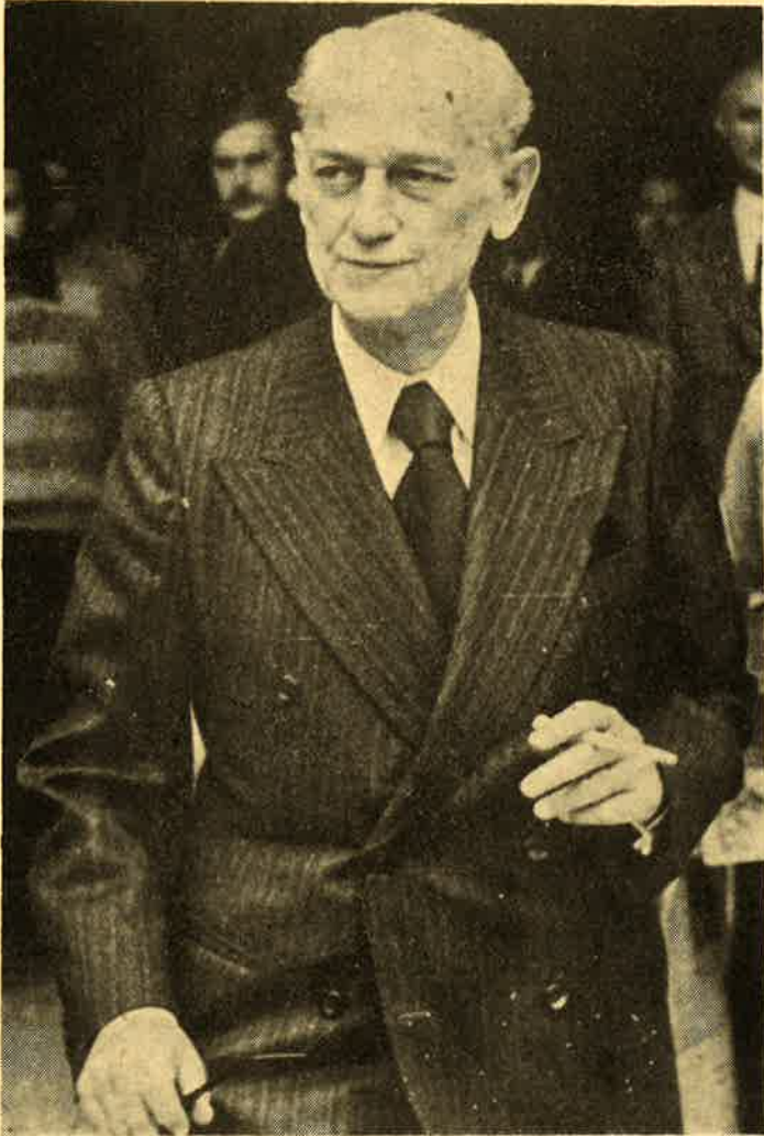
Ὁ Παναγιώτης Κανελλόπουλος σὲ προχωρημένη ἡλικία.

Αὐτὸ ἀκριβῶς πὺ πέτυχε σὲ σημαντικὸ βαθμὸ ὁ πολιτικὸς Παναγιώτης Κανελλόπουλος, πὺ ὑπῆρξε παράλληλα κορυφαῖος πνευματικὸς ἄνθρωπος.