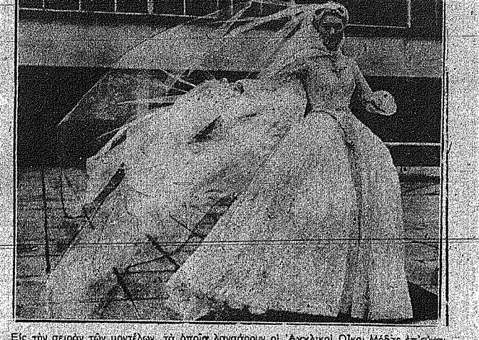
Είς τήν σειράν των μονίλων, τα οποία λαμβάνουσι οι Αγγλικοί Οίκοι Μόδας...