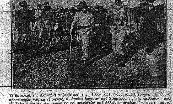
Ο βασιλεύς της Κιπρικής (κράτος της Υβόκας) Ναρόντι Σιχακού...