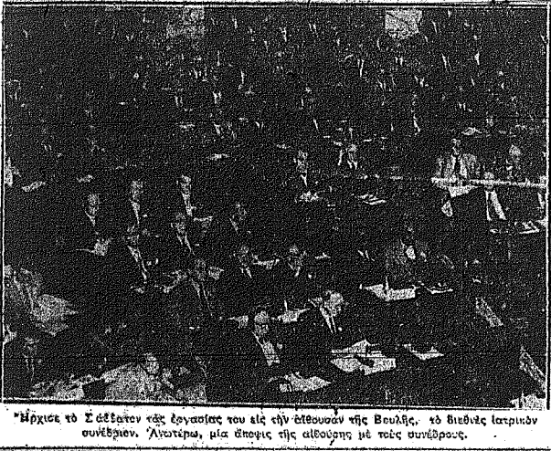
Μέλη του Συνεδρίου των Ιατρικών Συνεδρίων εις Αθήνας...