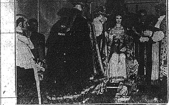
Είς την «Εκδήν τον Ίδεοδου Σπιού», εις τ. Βιργίγιαν, έγινε μία αναπαράστασις της στεφείας της βασίλισσας Βικτωρίας...»