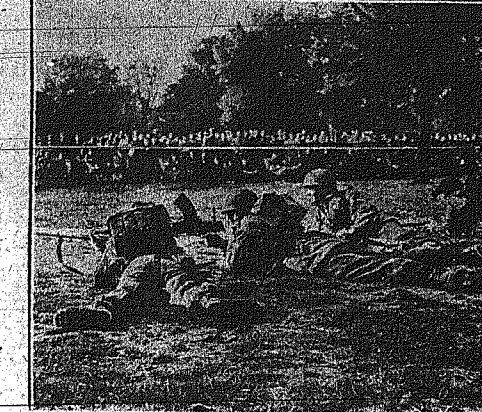
Είς το Χάυδ Πάρκ του Λονδίνου, πέπτε τμήματα εθελούθων του Ουασιόνστερ μετέχοντες...