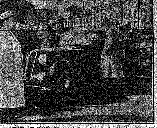
Εις τὴν Φοινικαία, ἕνα αὐτοκίνητον τῆς Σοβιετικῆς στρατιωτικῆς ἀποστολῆς...