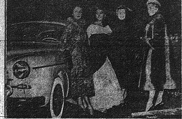
Εἰς τὴν ἑστῆσαν ἑστῆσαν τοῦ ἰσχυροῦ...