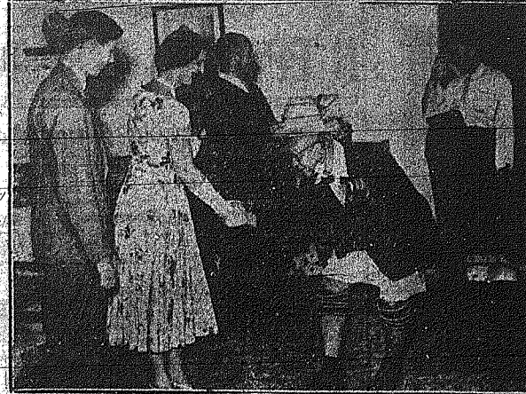
Κατά την επίσκεψή της Δουκίσσης του Κέντ εις Σαλαμίνας, η δούκισσα... Ο Φύλαρχος... η δούκισσα... η δούκισσα... η δούκισσα...