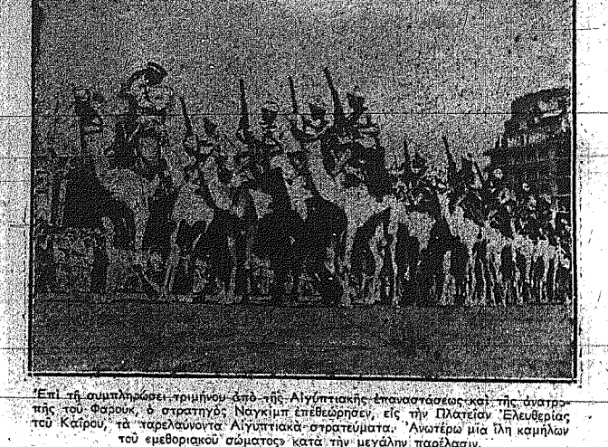
Επί τη συμπλήρωσις τριμήνου από της Αιγυπτιακής επανάστασης και της ανατροπής του Φαρούκ, ο στρατηγός Ναγκίμτ επεθεώραν, επί της Πλατείας 'Ελευθερίας του Καΐρου, τα 'παρελαινόντα Αιγυπτιακά στρατεύματα.