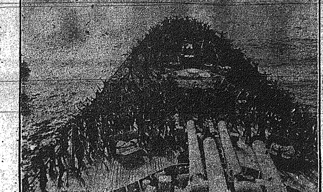
Οι άνδρες του Βρετανικού καταδρομικού «Βανγκάρδ» κινούν επί ένα «τάτρον» κατά πρώην άσκησης γυμναστικής...