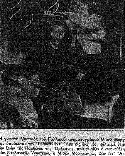
Η γυναίκα Ιωάννα Ντ' Αρκί, που ηγήθηκε της Παρθενίας της Ορλεάνης, που γύρισε σε σκηνή της Ντ' Αρκί.