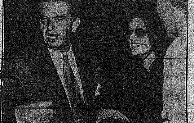
Παρά την φημη, δε άγασται την μοναξιά. Η τρις φορές ηθοποιός Γρετα Γκαρμπο...