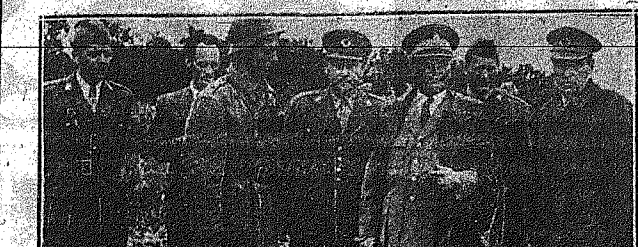
Άπο τά τελευταια γυμνάσια του Νοτιοανατολικού στατού εις τώ Ζάκωβη, Ο σταυρώσει Πίτο, έν μέση άνωτέρων, στρατιωτικών, λιμνών άνταράν έν μέση του διοικητού μέλη άντιπροσωπείας του θάλασσης.