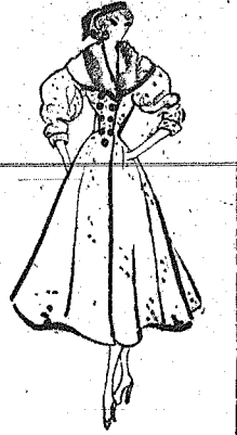
Επίδειξη της Νίνας Ρίτσι...