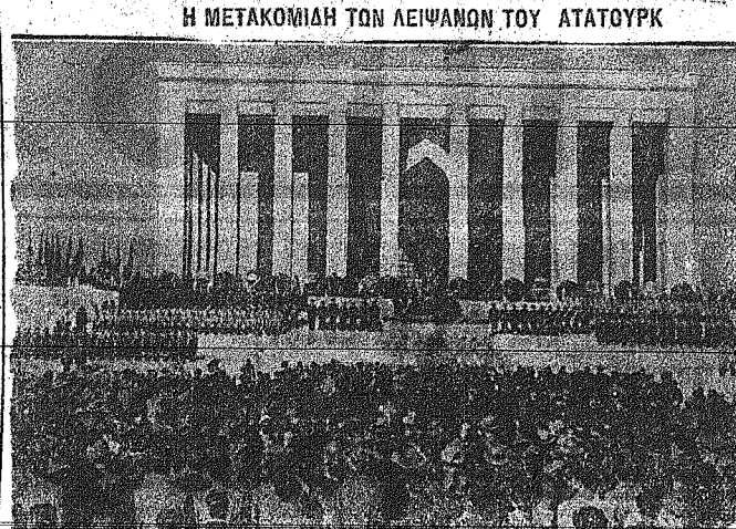
Ἀπὸ τὴν τελευτὴν τῆς μετακομιδῆς τῶν Λεβανῶν τὸ Ἀτάτουρκ εἰς τὸ νῦν μεσογειὸν πλοῖον τῆς Ἀγκυρας... Τμήματα ὑπὸ τὴν προστασίαν τοῦ ἐφερέτου, ἔμπροσθεν εἰς τὸ μνημεῖον, ὅπου ἔχουν καταστῆθαι κτήματα στέφανοι.

«Μὰ εἶναι ἐκτακτό! Εἶναι ἀριστούργημα αὐτό!»... «Καί, τὰ γέλια «ἐξακολουθοῦσαν γι' αὐτό τὸ ἐκτακτό» τὸ εὐριστούργημα ποὺ εἶχε διηγήσῃ μὲ τὸ πλοῦ χιούμρ ἕνα ἀπὸ τὴν συντροφία καὶ ποὺ ἀφορούσε μὲ ἀνέμετρο καὶ πολύ μοντέρνα φάρσα μερικῶν ἀθηναίων ἐνός γυναικίου εἰς ἕδραν τῶν καθηγητῶν.