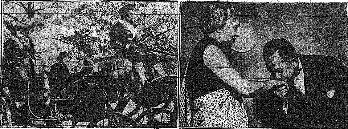
Άριστο: Ο Βασιλεύς Παύλος και η Βασίλισσα Φρειδερίκη... Άριστο: Ο Βασιλεύς Παύλος και η Βασίλισσα Φρειδερίκη...