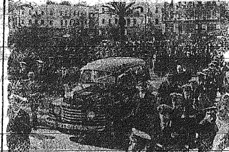
Η βασιλική πομπή επιστρέφει εις την πόλιν των Αθηνών...