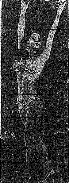
Η Γερμανία ετοίμη δόξα, η ακανόνιστη αλλά και ακανόνη χορεύτρια Αθηνά Ράκι...