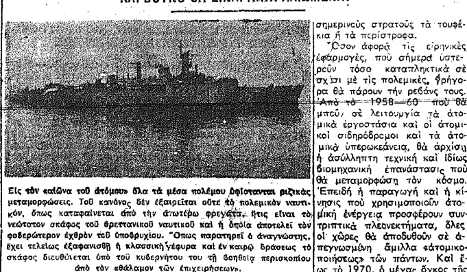
Εἰς τὴν ἐκδοὺν τοῦ ἀέρος... Εἰς τὴν ἐκδοὺν τοῦ ἀέρος...

ΜΕΤΑ ΜΙΑΝ ΊΣΕΤΙΑΝ ΟΙ ΒΙΟΜΗΧΑΝΙΕΣ ΚΑΙ ΟΙ ΣΙΔΗΡΟΔΡΟΜΟΙ ΘΑ ΚΙΝΟΥΝΤΑΙ ΜΕ ΑΤΟΜΙΚΗΝ ΕΝΕΡΓΕΙΑΝ. ΤΟ ΠΕΤΡΕΛΑΙΟ ΚΑΙ ΤΟ ΚΑΡΒΟΥΝΟ ΘΑ ΕΙΝΑΙ ΑΠΗΡΧΑΙΟΜΕΝΑ!