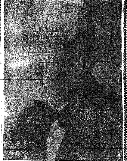
Παρακολουθούσαν τας πρωτοφανείς Συνεδριάσεις του Ύψωνιστού