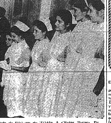
Τὴν παρεβούθησαν ἑδωραθὰ ἐπιπέδου ἀπορίας τῆς «Οὐρα» ἀπορίας, ὡς ἀπορίας τῆς ἀπορίας, ἀναφέρεται ἐπὶ τῇ ἀναγνώσει τῶν ἀπορίας τῆς «Οὐρα» ἀπορίας.