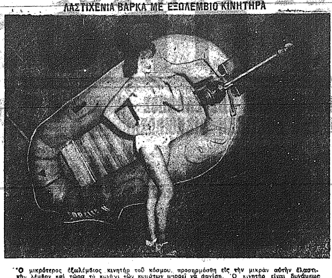
Ὁ μικρότερος ἐξοπλισμὸς κινητῆρ τοῦ κόσμου, προσαρμοσθὲν εἰς τὴν μικρὰν σκάην ἐλαστικῆς λαμίας, καὶ τὸ κύριον τὸν κινήσει μὲ ἀρχὴν. Ὁ κινητῆρ εἶναι δύναμιος 150 πῶδων, ἔχει 350 κυβικά ἐκτασμοὶ κινεῖται ὅλην ἡμέραν, καὶ ἔχει 25 ἰσχυροὺς ἀετοὺς ἀετοῦ.