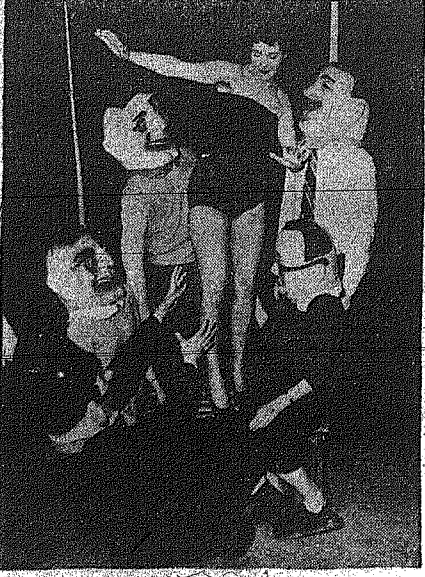
Δεν είναι μόνον φαναριές να περνούν, ή άποια διακοσμητικά στον δρόμο της πόλης. Είναι μια γερμανική λαοκρατία και οι κάτοικοι της που την περιγράφουν είναι οι άνθρωποι της Γερμανίας, οι οποίοι γίνονται οι Κάρναβαλ, στη Γερμανία, άνοιξη...