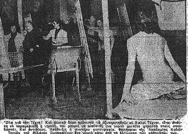
Όλα γιά τήν τέχνη! Καί ούσιακά όσον πρόκειται γιά ελευθερία τήν καί τήν...