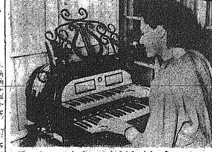
Ένα νέον μουσικό όργανο έπεδείχθη από τον περιηγητή μουσικού όργανου άπό την Αμερική έδωκεν παράδειγμα της όμορφότητάς του. Το όργανο άπό την Αμερική έδωκεν παράδειγμα της όμορφότητάς του. Το όργανο άπό την Αμερική έδωκεν παράδειγμα της όμορφότητάς του.