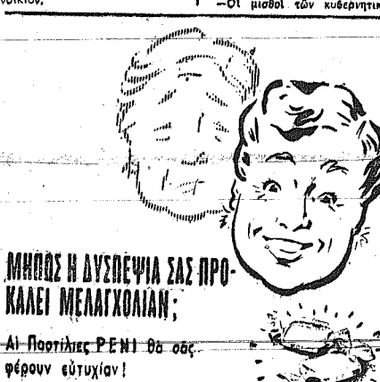
ΜΗΠΟΣ Η ΔΥΣΠΝΩΙΑ ΣΑΣ ΠΡΟΚΑΛΕΙ ΜΕΛΑΛΧΟΛΙΑΝ;

Αι Ποιητικές PENI θα σας φέρουν εύτυχιο!