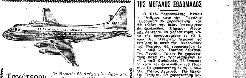
Ταχύτερον εις ΒΗΡΥΤΟΝ ΑΘΗΝΑΣ ΡΩΜΗΝ ΛΟΝΔΙΝΟΝ